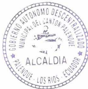
Alfredo Amador Chang Hi Fong ALCALDE DEL GADMC PALENQUE

CERTIFICO: Que la presente ORDENANZA SUSTITUTIVA QUE REGULA LA FORMACIÓN DEL CATASTRO PREDIAL URBANO DEL CANTÓN PALENQUE, LA DETERMINACIÓN, ADMINISTRACIÓN Y RECAUDACIÓN DEL IMPUESTO A LOS PREDIOS URBANOS PARA EL BIENIO 2021-2022, fue sancionada y ordenada su promulgación por el Señor Alfredo Amador Chang Hi Fong, Alcalde del Gobierno Autónomo Descentralizado Municipal del Cantón Palenque, el veintisiete de noviembre del dos mil veinte.