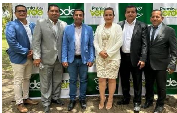
Fotografía 15: Participación la séptima edición del proyecto PREMIO VERDE 2023 en la ciudad de Quito