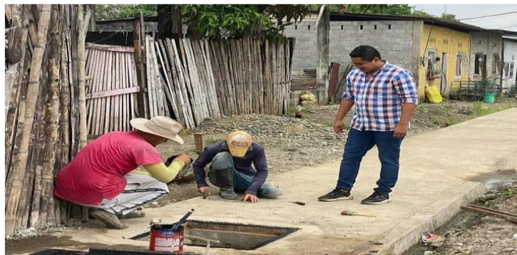
Fotografía 5: Inspección de trabajos que se realizan en el sector el Chavaco