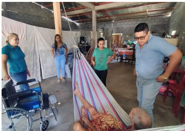
Fotografía 13: Entrega de ayudas Técnicas a Personas con Discapacidad