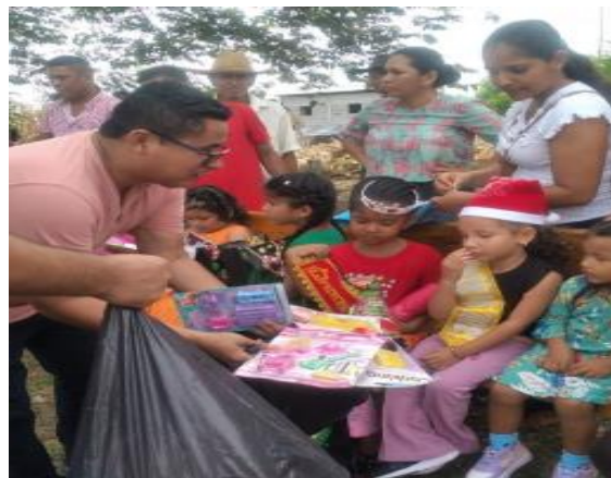
Fotografía 23: Agasajo navideño a los niños del Recinto Lomas Aisladas