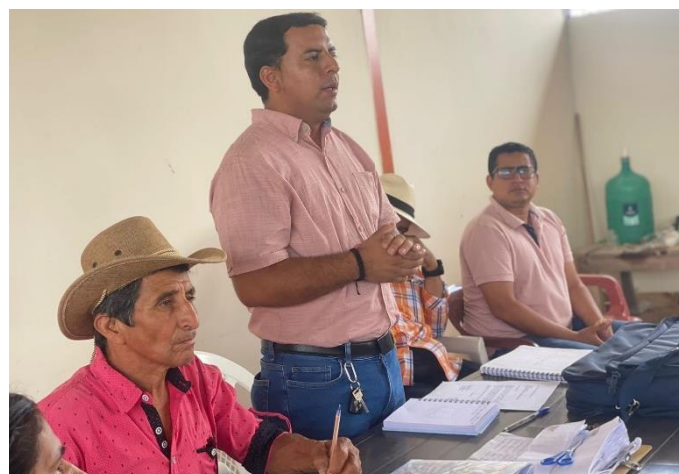
Fotografía 18: Dialogo con miembros asociación Agrícola Las Palmitas