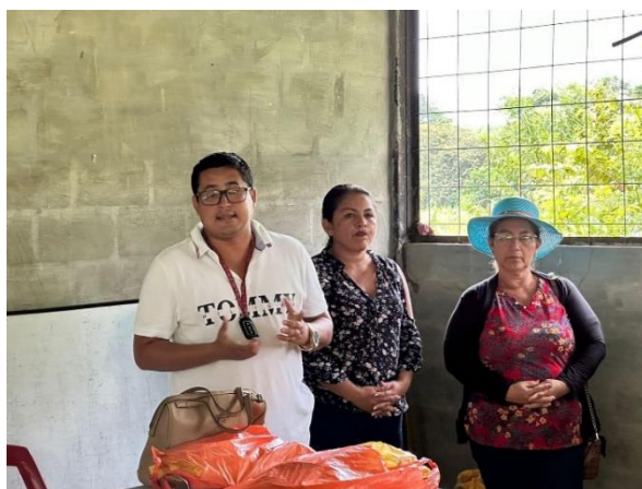
Fotografía 12: Conversatorio con moradores del Recinto el Naranjo