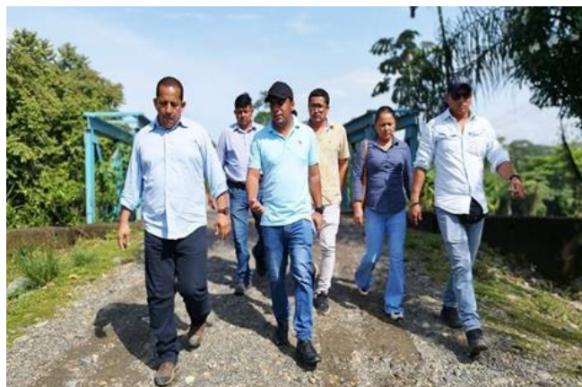
Fotografía 3: Inspección en el puente Pise