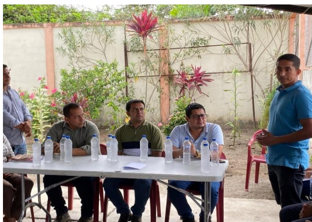
Fotografía 20: diálogo con miembros del Comité del Seguro Social Campesino