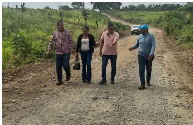
Fotografía 8: Inspección de maquinaria en el Recinto Bajo Hondo