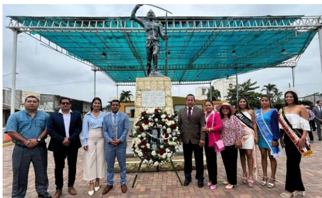
Fotografía 11: homenaje al coronel Nicolás Infante