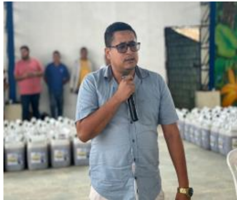
Fotografía 22: entrega de 400 kits agrícolas en la zona rural