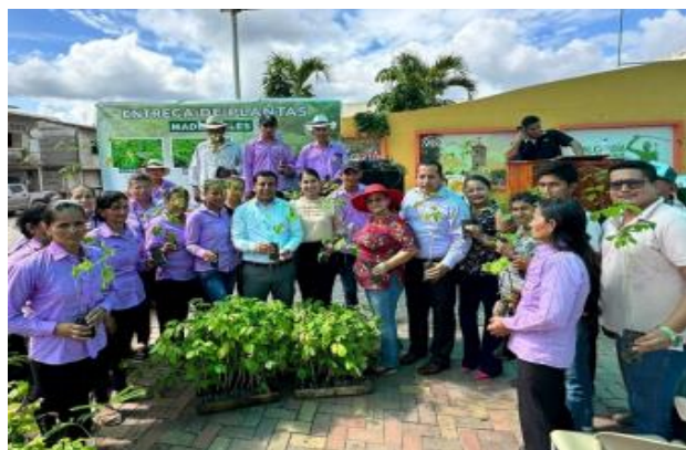
Fotografía 24: Entrega de plantas maderables (Pachaco y Guayacán), a miembros de diversas asociaciones agrícolas de la zona rural del cantón