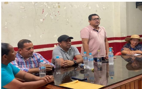
Fotografía 19: Diálogo con los miembros del Sindicato Único de Obreros y Trabajadores Municipales