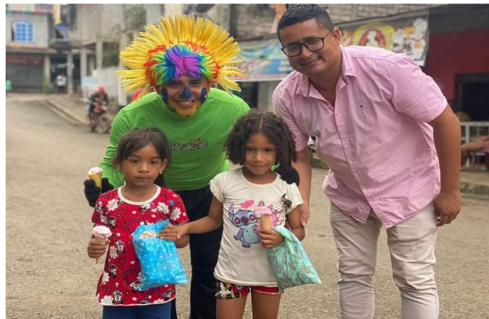
Fotografía 4: Entrega de dulces y helados por el día del niño