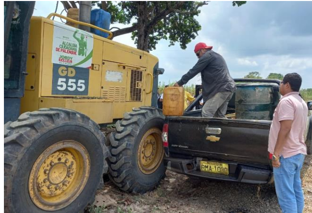
Fotografía 16: inspección de los trabajos que está realizando el equipo camionero en el Recinto Maculillo