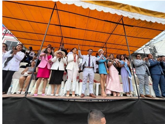
Fotografía 7: Participación en el desfile cívico del 02 de agosto