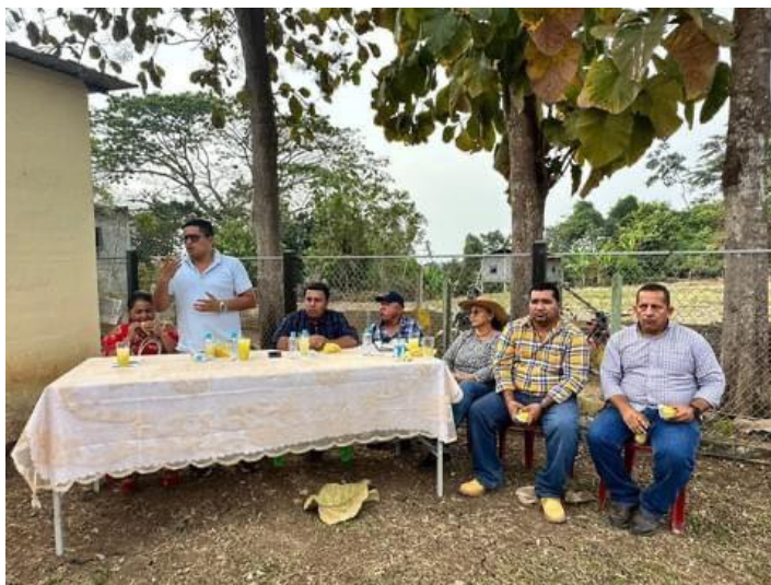
Fotografía 14: Conversatorio con moradores del sector Malvar