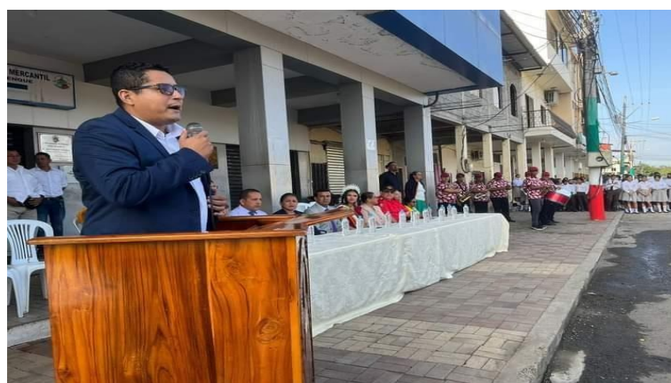
Fotografía 6: Participación en hora cívica del 25 de julio