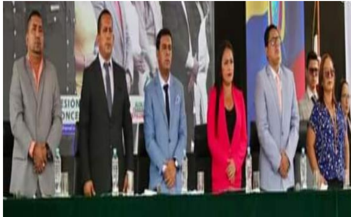
Fotografía 1: Sesión Inaugural