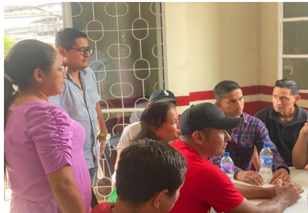
Fotografía 17: Socialización del presupuesto participativo 2024