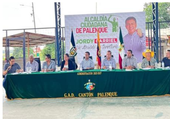
Fotografía 9: Primera Sesión de Concejo Municipal en territorio, en el recinto La Libertad