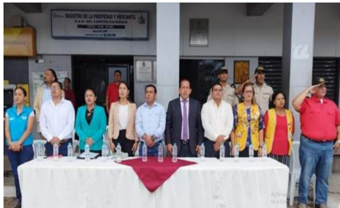
Fotografía 2: Hora cívica por la B.P