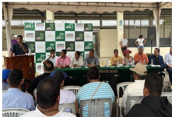
Fotografía 10: Socialización del traslado de comerciantes a las nuevas instalaciones del Mercado Municipal